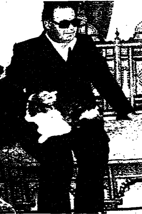
الرئيس الحصن في منزله أمس بإحدى غرفته

ترأس الرئيس سليم الحص مساء أمس اجتماع عمل في منزله بالدوحة، حضره وزير الأشغال المهندس أسعد البزري ورئيس بنك التنمية العربي الدكتور صائب الجارودي ورئيس مجلس الإنماء والإعمار الدكتور محمد عطالله.